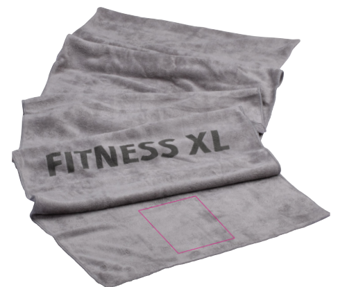
Abbildung oben 1:1

Fitness-Handtuch mit abgenähtem Umschlag, zur Befestigung an der Rückenlehne des Fitnessgeräts, extra lang (1,40 m), super absorbierend, schnell trocknend, Mikrofaser, grau